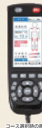
コース選択時の画面